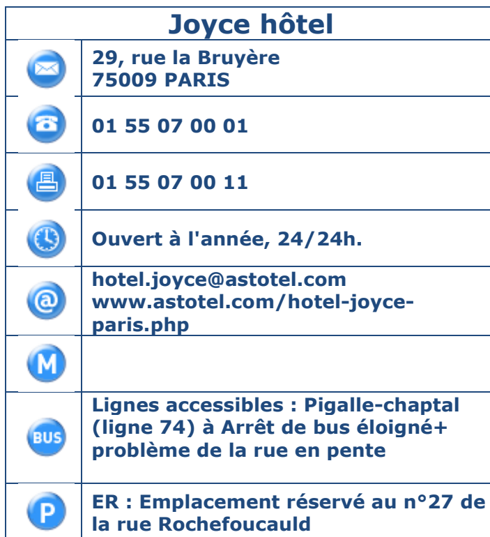
Tableau 1 : Coordonnées, horaires et transports en commun.

Présentation de l'établissement : Au cœur du 9e arrondissement, le nouvel hôtel Joyce ouvert en novembre 2009 est une réussite de confort et d'élégance, d'une exceptionnelle luminosité. Une référence de l'hôtellerie parisienne où chaque chambre est unique et le salon sous verrière (non fumeurs privilégiés) mérite de s'y attarder.