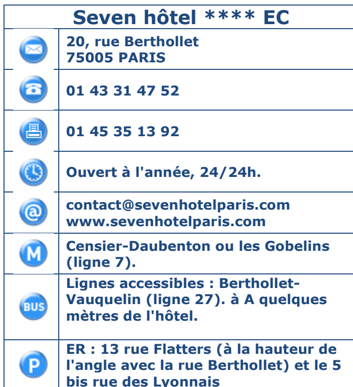
Tableau 1 : Coordonnées, horaires et transports en commun.

Présentation de l'établissement : Situé dans le quartier Latin, l'hôtel Seven Paris propose à ses clients des chambres originales, design, luxueuses et confortables. Certaines disposent d'un lit à lévitation. L'hôtel garantit des sensations inédites et invite à une voyage hors du commun au cœur de fictions originales.