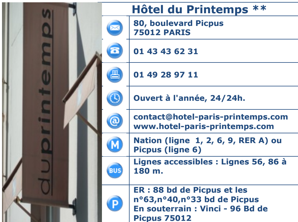
Tableau 1 : Coordonnées, horaires et transports en commun.

Présentation de l'établissement : Idéalement situé à quelques pas de Nation dans une avenue parisienne calme et verdoyante, l'Hôtel du Printemps vous séduira par son charme élégant, discret et son accueil chaleureux. Boutique hôtel entièrement rénové et à très bon rapport qualité/prix.