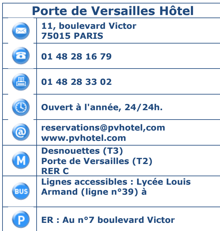
Tableau 1 : Coordonnées, horaires et transports en commun.

Présentation de l'établissement : Le "Porte de Versailles Hôtel" est un établissement situé à 5 minutes à pied du Parc des Expositions de la Porte de Versailles et du Palais des Sports.