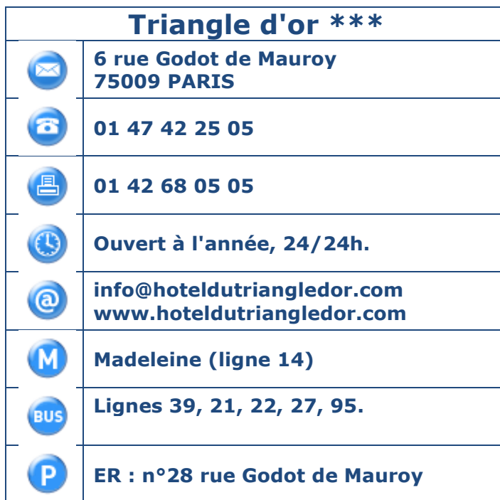
Tableau 1 : Coordonnées, horaires et transports en commun.