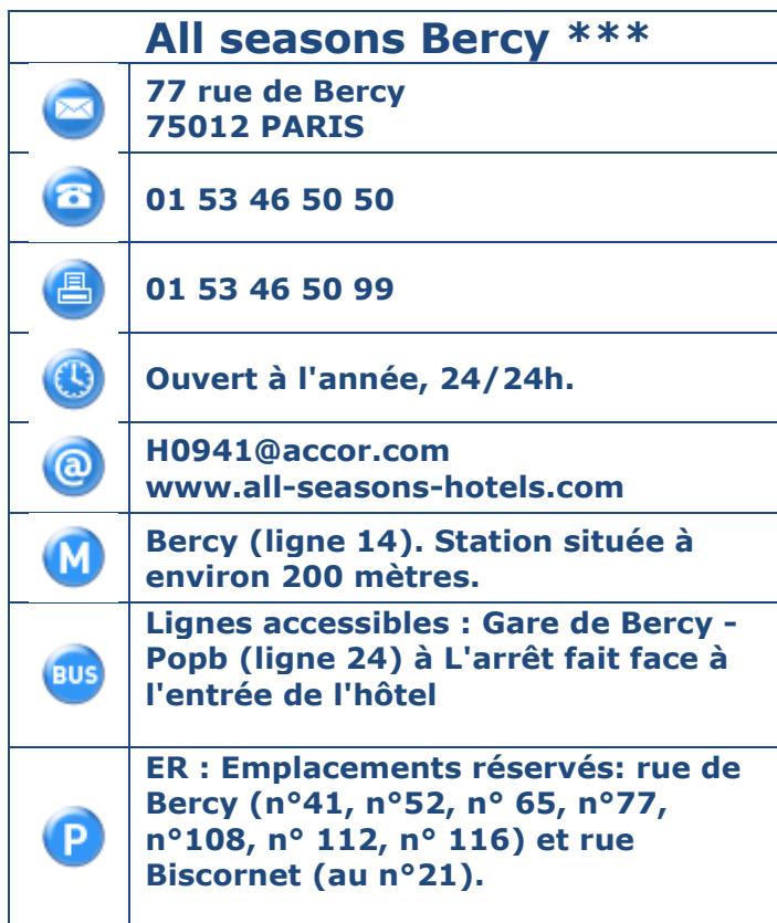
Tableau 1 : Coordonnées, horaires et transports en commun.

Présentation de l'établissement : L'équipe du All Seasons Paris Bercy*** vous invite à découvrir son offre tout inclus (chambre, petit déjeuner et wifi illimité). Nos 361 chambres climatisées ont été récemment entièrement rénovées (2008). Jouissant d'une situation idéale, l'hôtel est placé au pied du palais omnisport de Paris et à quelques pas de Bercy Village et de ses cafés, boutiques et restaurants. Les gares de Lyon et de Bercy sont très proches et la ligne de métro 14 vous permettra de rallier les quartiers de l'Opéra, du Louvre et les grands magasins en quelques minutes. L'hôtel, dont la terrasse domine le parc de Bercy propose : restaurant, bar, séminaires, parking public payant.