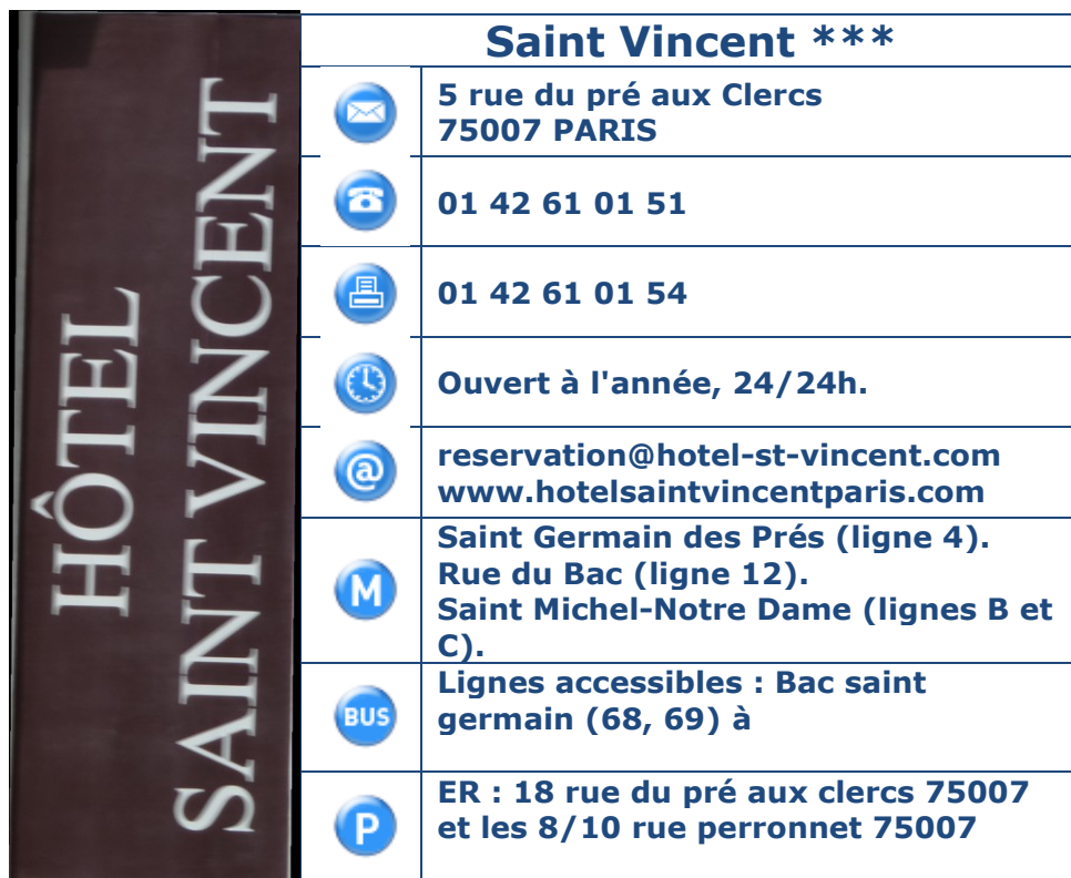
Tableau 1 : Coordonnées, horaires et transports en commun.

Présentation de l'établissement : Situé dans une rue très calme au coeur de Saint Germain des Prés, cette maison de charme allie chic parisien, modernité des équipements et style Napoléon III. Le saint Vincent vous offrira confort et quiétude, grâce et esthétisme au sein de l'effervescence des hauts lieux de la culture parisienne.