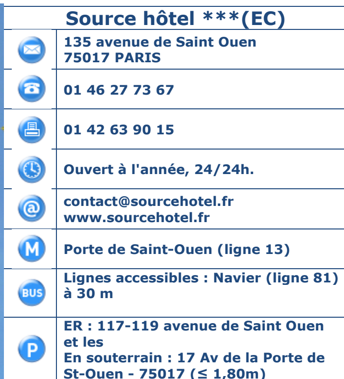
Tableau 1 : Coordonnées, horaires et transports en commun.

Présentation de l'établissement : A deux pas de Montmartre, du marché aux Puces et à 10 mn en bus de l'Opéra et du Louvre, le Source hôtel est un petit hôtel familial à la fibre écolo, offrant une décoration résolument contemporaine et design à un rapport qualité/prix imbattable. Etablissement de 38 ch. - 2 chambres adaptées- Personnel sensibilisé- Chien d'assistance accueilli (obligatoire loi N°87-588). - Petit-déjeuner (PDJ) en buffet