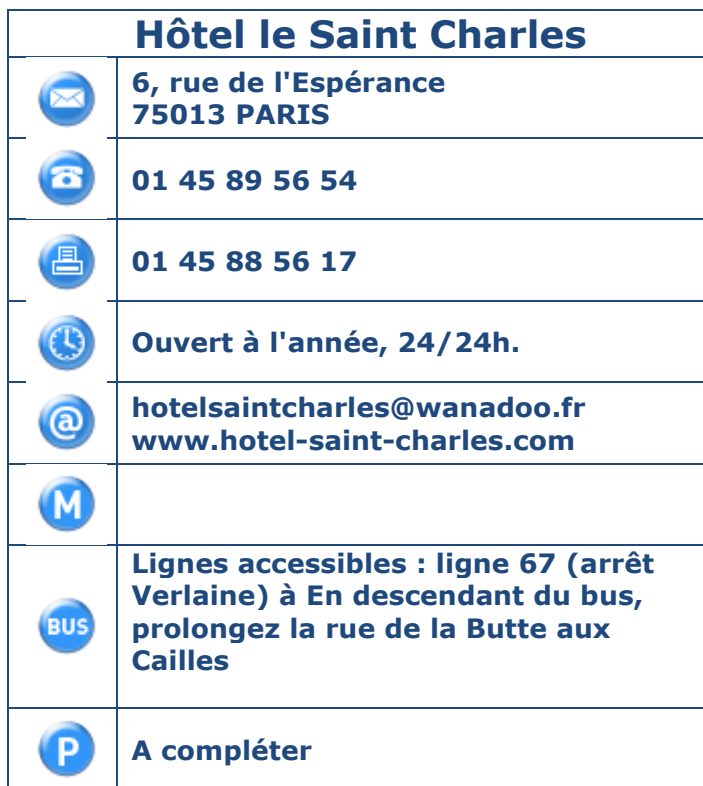
Tableau 1 : Coordonnées, horaires et transports en commun.

Présentation de l'établissement : Bel hôtel de 57 chambres au cœur du quartier bohème et festif de la Butte aux Cailles. Tout récemment rénové, l'hôtel met à votre disposition de belles chambres doubles, familiales ou simples. Certaines disposent d'une terrasse, avec vue sur tout le quartier. L'hôtel St Charles propose un très bon rapport qualité/prix.