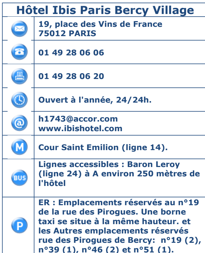
Tableau 1 : Coordonnées, horaires et transports en commun.

Présentation de l'établissement : Cet hôtel Ibis est idéalement situé au cœur du quartier Bercy Village. Retrouvez ses restaurants, cafés, boutiques et son parc à quelques pas de là. Les gares de Lyon et d'Austerlitz sont situées à proximité de l'Ibis Paris Bercy Village et la gare Saint Lazare peut être ralliée en quelques minutes grâce à la ligne de métro 14. Il vous propose à la réservation 195 chambres climatisées équipées Wifi. Un restaurant 'Café', un bar, des en-cas 24h/24, une terrasse, un parking public extérieur et un parking public couvert payant sont à votre disposition. Les animaux sont acceptés. Notez que la rue