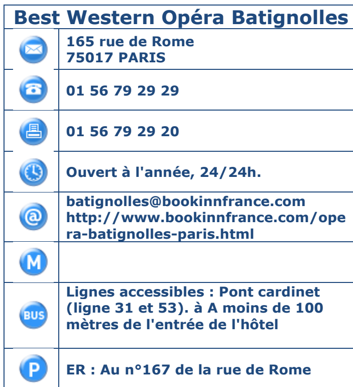
Tableau 1 : Coordonnées, horaires et transports en commun.

Présentation de l'établissement : L'hôtel Best Western Opéra Batignolles vous accueille à deux pas du village des Batignolles. Entièrement rénové fin 2010, il vous offre confort et modernité: mobilier design, accès wifi gratuit dans toutes les chambres, écran plat avec lecteur DVD et minibar.