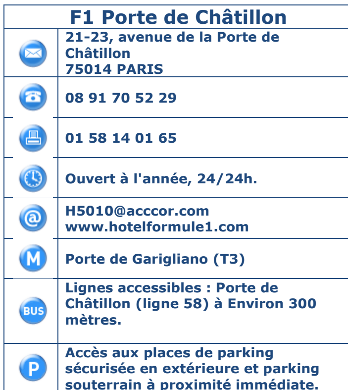
Tableau 1 : Coordonnées, horaires et transports en commun.

Présentation de l'établissement : Situé dans le 14e arrondissement, l'hôtel F1 Porte de Châtillon propose des chambres fonctionnelles au meilleur prix. Ses 354 chambres sont proposées en trio ou en double, pour s'adapter au mieux à vos besoins, s'il que vous voyagez en famille ou entre amis. Wc et sanitaires non attenants, à deux pas de la chambre. 9 chambres adaptées- Personnel sensibilisé- Chien d'assistance accueilli (obligatoire loi N°87-588). - Pdj en buffet