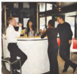
Exclusif: un bar bar à bord