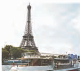
Au pied de la Tour Eiffel

tarifs communiqués sous réserve de modification