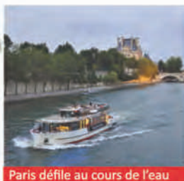
Paris défile au cours de l'eau